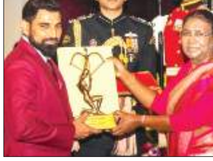
भारत के तेज गेंदबाज मोहम्मद शमी को भारत की राष्ट्रपति द्रौपदी मुर्मू द्वारा अर्जुन पुरस्कार से सम्मानित किया गया।